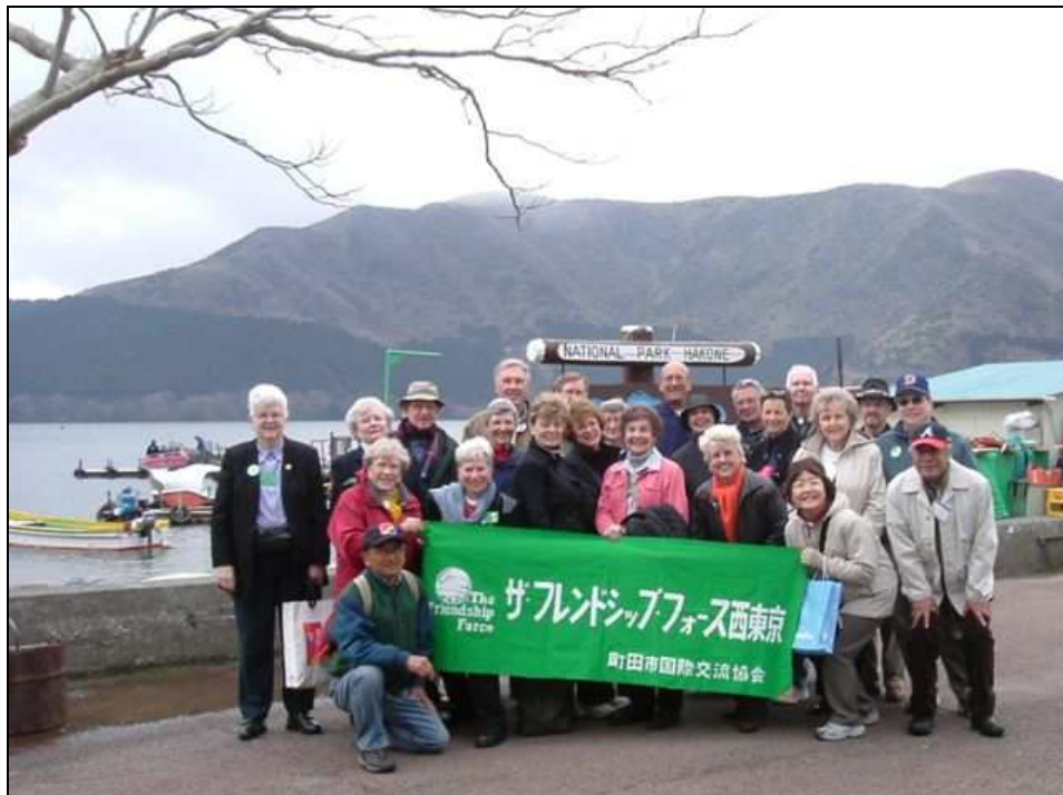
アメリカ ノースカロライナ ラーレイクラブ 箱根観光