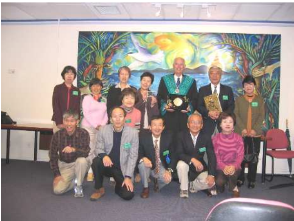
正装したミルン市長と・・・

後半は二泊組と六泊組に分かれて南島への観光。幸運にも快晴続きに恵まれて、マウントクックやクインズタウン、ミルフォードサウンドやクライストチャーチなどの素晴らしい風光をすっかり堪能しました。Kiwi国の大自然と、Kiwi人の友情に大感謝です。