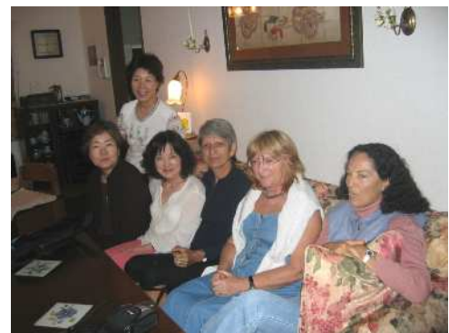
会員宅でのホームパーティー

お会いしてみるとほとんどがフランス人で、明るく楽しく、歩くのが大好き、歌ったり踊ったり、また、日本文化への好奇心も旺盛な人が多く、活動的な 50 代、60 代の人達でした。